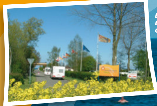
Da sind wir! Einfahrt zum Campingplatz