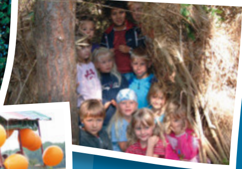
Die wilden Höhlenkinder