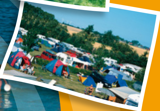
Blick über Nachbarn und Felder