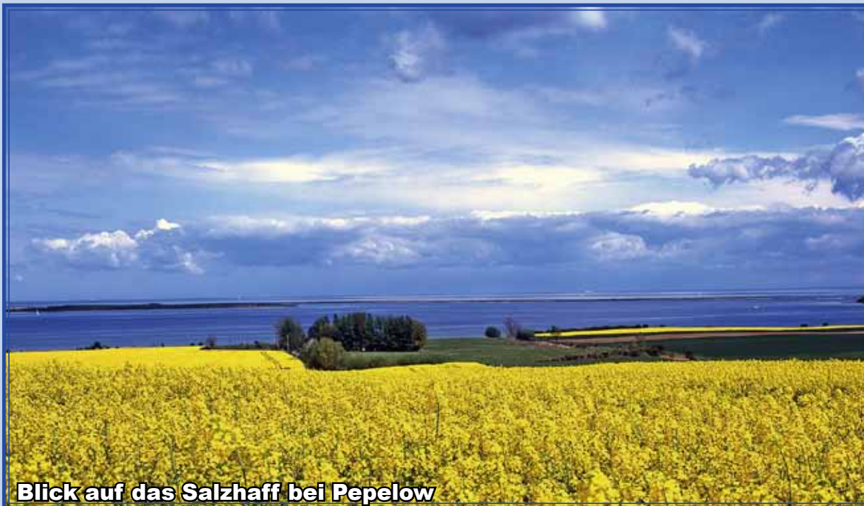
Blick auf das Salzhaff bei Pepelow